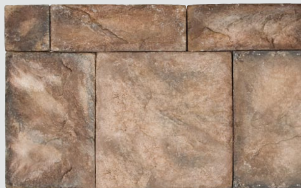
80x80, 80x240, 160x240, 240x240, 240x320 mm