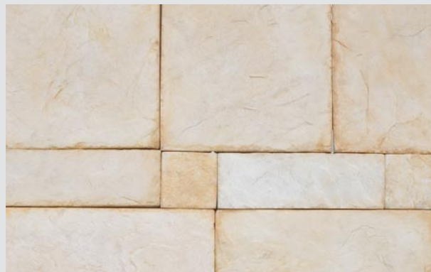
80x80, 80x240, 160x240, 240x240, 240x320 mm